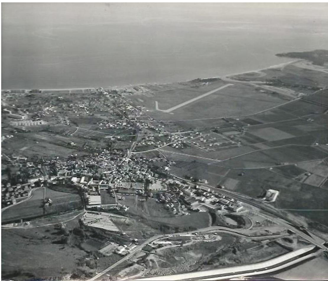
L'aéronautique navale à Fréjus – vue aérienne – années 1960